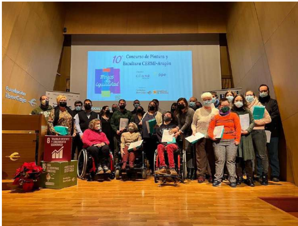
Foto de familia de la gala de premios con todos los ganadores